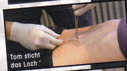
Tom sticht das Loch