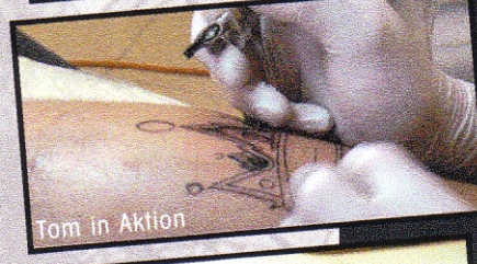
Tom in Aktion